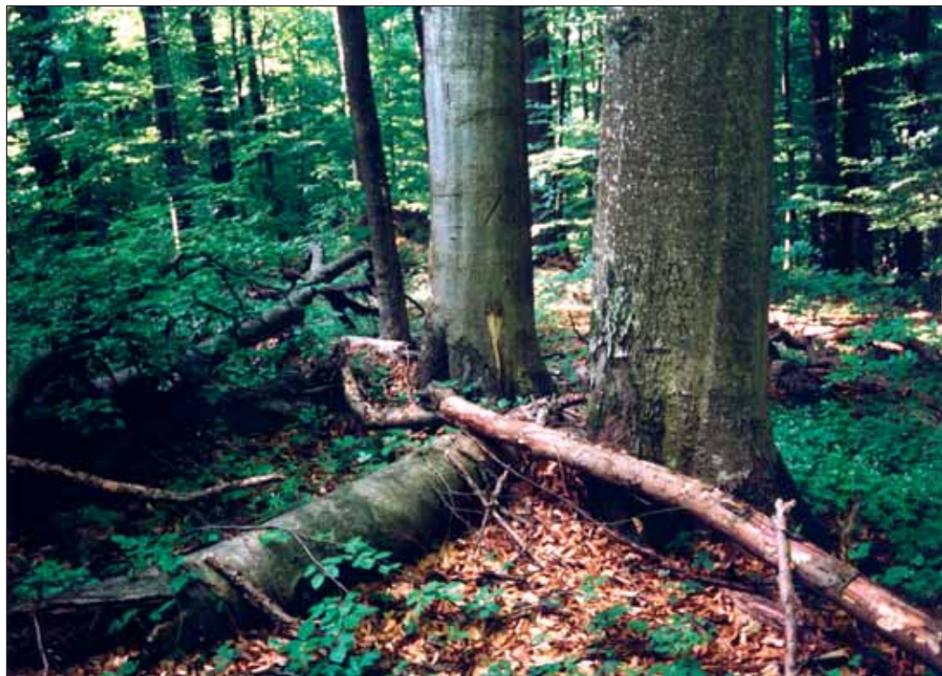
Svetové prírodné dedičstvo UNESCO – Karpatské bukové pralesy v NP Poloniny.