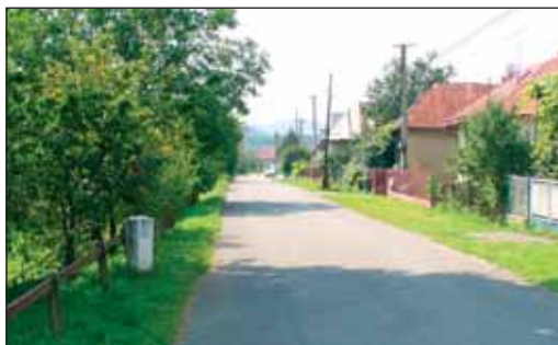
Pôvodný kilometrovník cesty Porta Rusica v obci Stakčín, ktorý sa zachoval dodnes.

Ani to však nie je všetko: cesta má byť podľa plánov niektorých regionálnych politikov úplne zničená a na jej mieste má stať cesta nová, postavená pre potreby au-