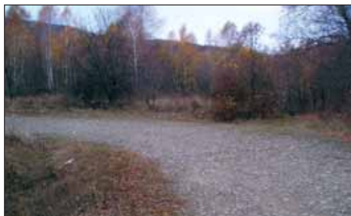
Zachovaný úsek cesty Porta Rusica pod Ruským sedlom.

nelegálne prejazdy motorovými vozidlami a pamiatka tak ďalej chátra.